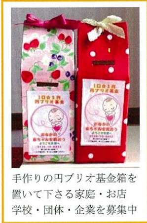
手作りの円ブリオ基金箱を置いて下さる家庭・お店 学校・団体・企業を募集中